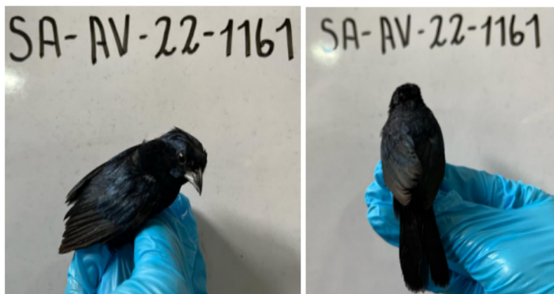
Fotografías 2 y 3. Individuo incautado Volatinia jacarina (Espiguero saltarín), rótulo SA-AV-22-1161. Acta Única de Control al tráfico ilegal de flora y fauna silvestre 161694.